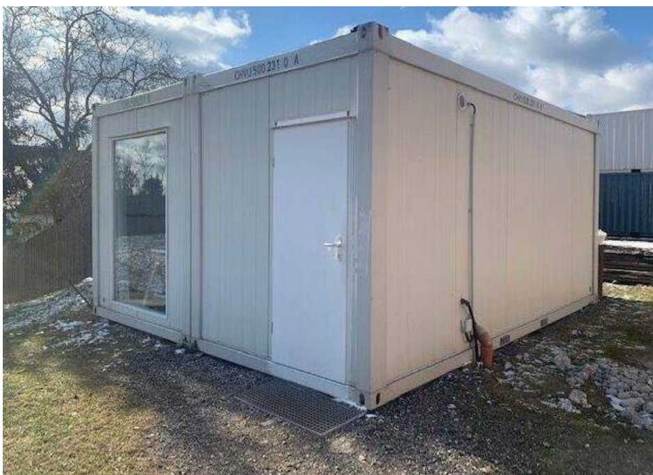
Musterfoto unseres Jugendcontainers

Wir haben in unserer Gemeinde Gott sei Dank sehr viele motivierte Jugendliche. Aufgrund dessen wird auch ein neuer Jugendcontainer für unsere Jugend angekauft und ein neuer Jugendtreff zur Verfügung gestellt.